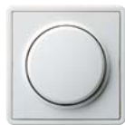
A Reinweiß (ähnl. RAL 9010)