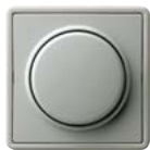
A Grau (ähnl. RAL 7038)