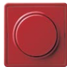
A Rot (ähnl. RAL 3003)