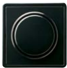
A Schwarz (ähnl. RAL 9005)